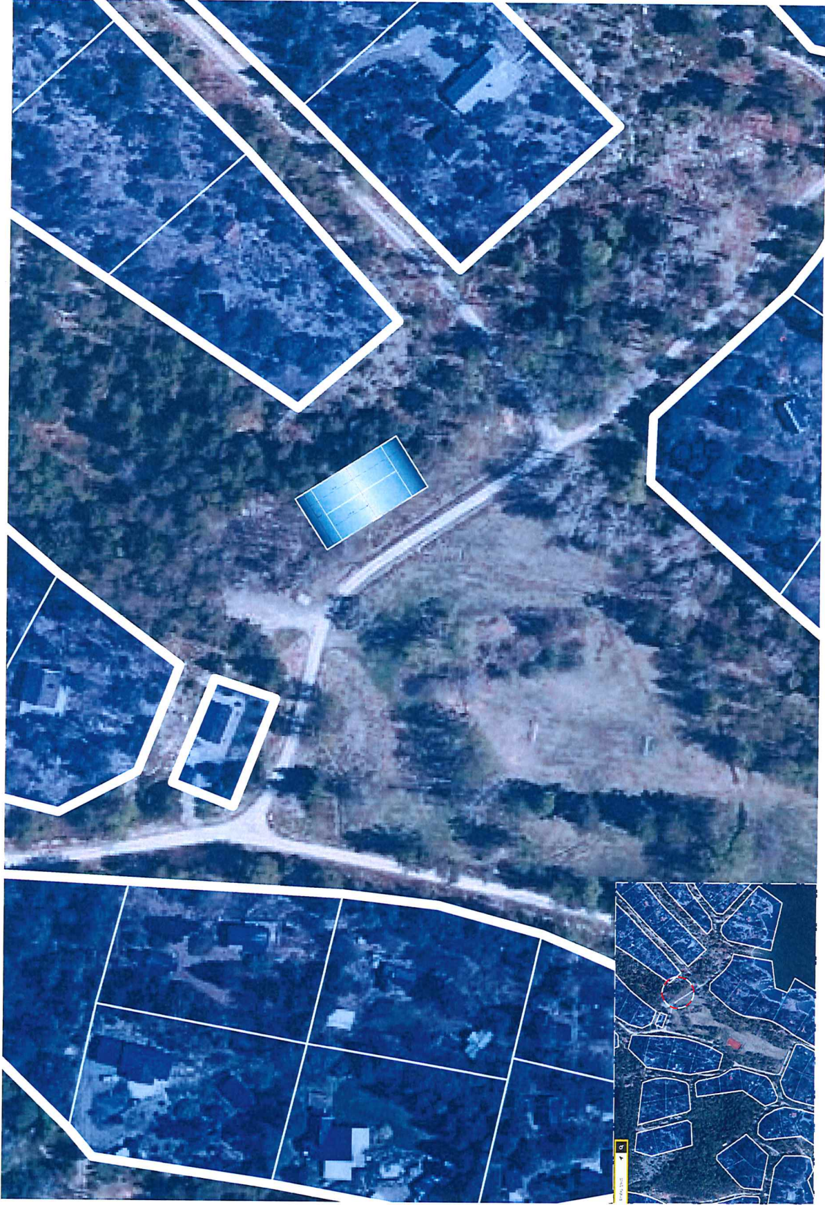
FÖRSLAG NY PADELBANA ALT. C (Strandvägen-högvägen) ILLUSTRATIONSSKISS SKALA 1:500 (A3) - 2021-02-12